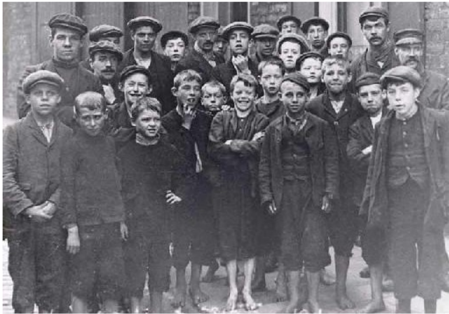
Des gamins et des darons posent pendant la grève des transports, Liverpool, 1911