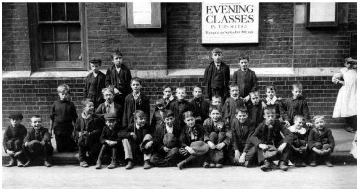
écoliers en grève, Londres, 1911