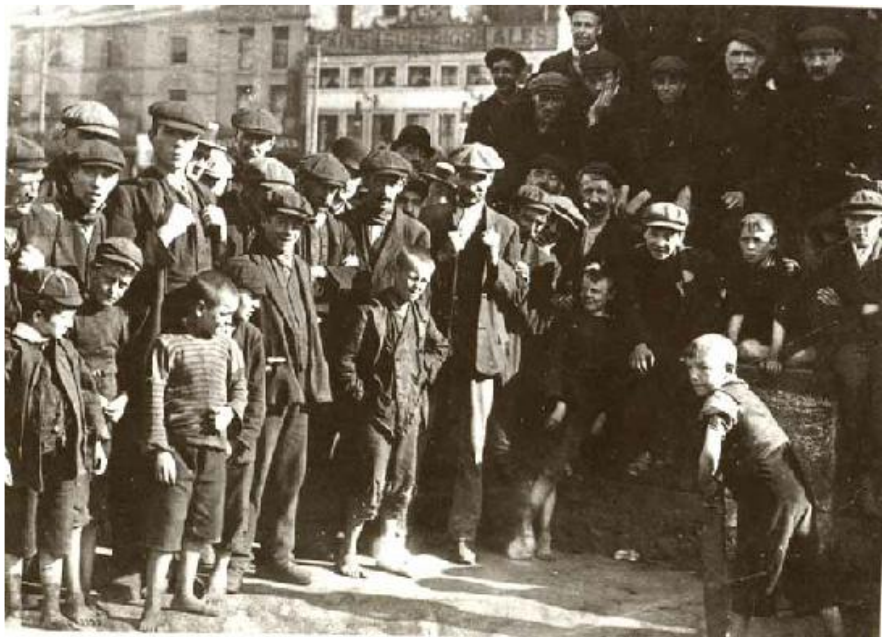
Des gosses jouent au cricket dans la rue, Liverpool, 1911