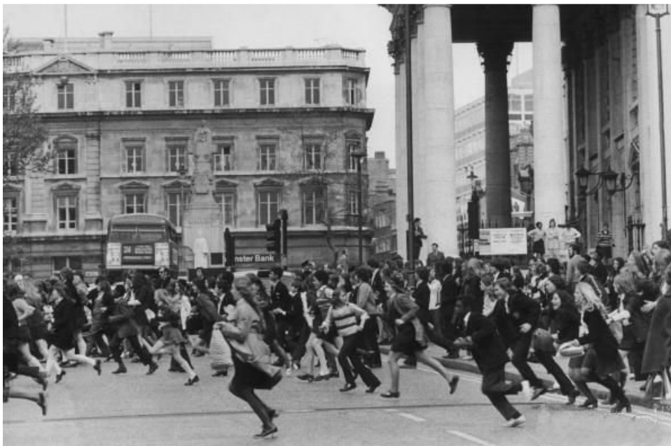
Running, Londres, 1972