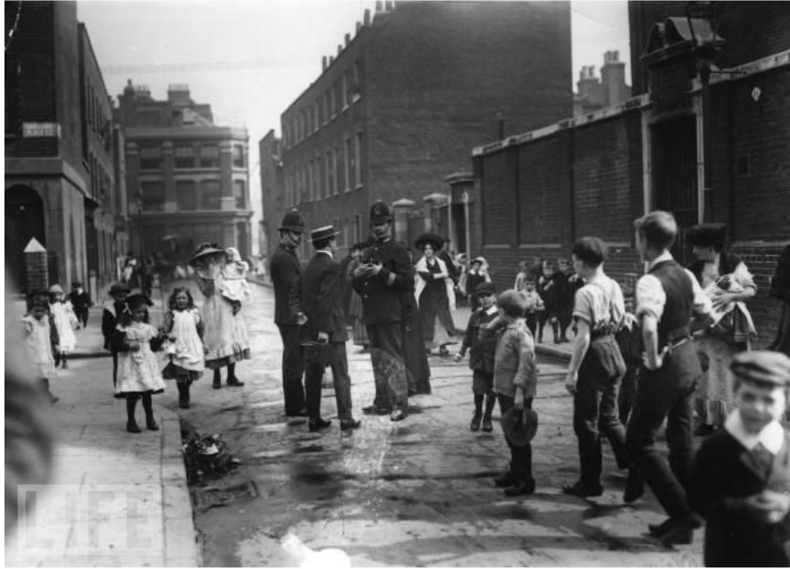
Flics et grévistes devant l'école de Shoreditch, Londres, 1911