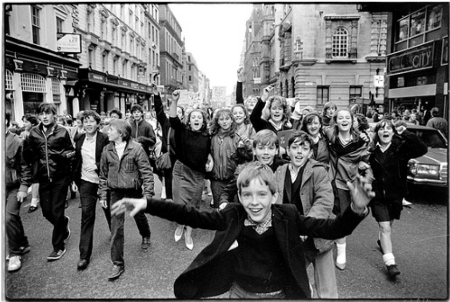
Thatcher generation, 1985