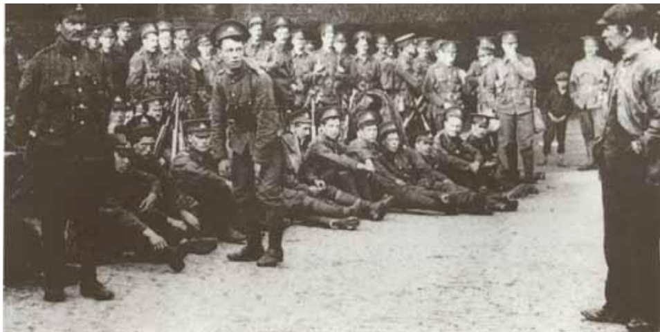
Un docker toise des soldats durant la grève des transports, Liverpool, 1911

ont davantage mis en contact avec les événements quotidiens. La conduite de la grève révèle une grande familiarité avec les méthodes employées par les cheminots et les dockers durant la grève » ( Birmingham Daily Mail , 14 septembre).