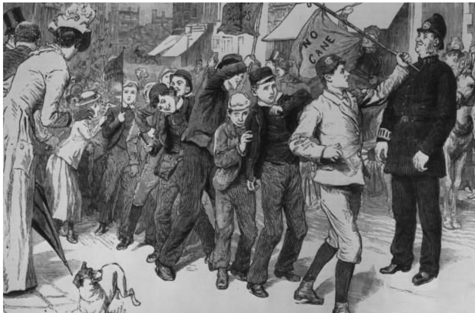
"NO CANE", 1899