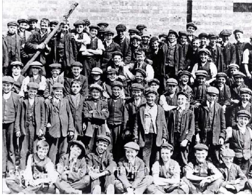
Jeunes travailleurs en lutte durant la grève des transports, Liverpool, 1911