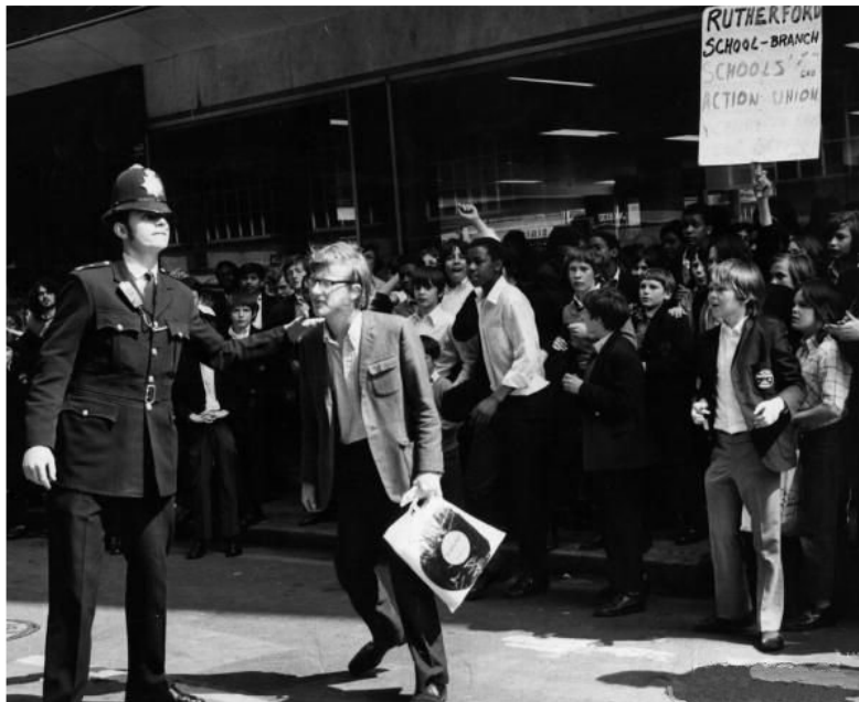
"SCHOOLS ACTION UNION", Londres, 1972