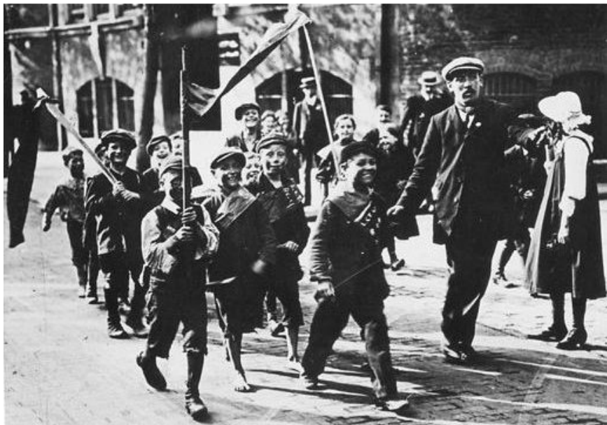
Des enfants imitent les dockeurs, Londres, 1911